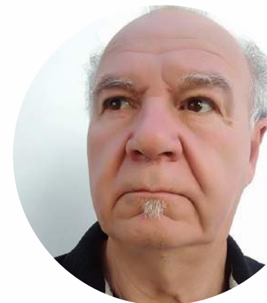
ΛΥΜΠΕΡΟΠΟΥΛΟΣ ΝΙΚΟΛΑΟΣ Εύβοιας

Γεννήθηκε στην Αθήνα και ζει στο Χαλάνδρι. Σπούδασε Χημικός Μηχανικός στο MIT και έκανε μεταπτυχιακές και διδακτορικές σπουδές στο CALTECH των ΗΠΑ. Σήμερα είναι καθηγητής της Σχολής Χημικών Μηχανικών ΕΜΠ, με γνωστικό αντικείμενο την Περιβαλλοντική Βιοτεχνολογία. Ιδρυτικό μέλος του Ελληνικού Υδατικού Συνδέσμου. Είναι πρόεδρος του Δημοτικού Συμβουλίου Χαλανδρίου και εντεταλμένος για θέματα ανακύκλωσης. Υπεύθυνος του Τομέα Παιδείας του ΜΕΡΑ25.