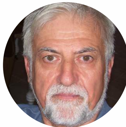
ΣΑΜΟΥΤΗΣ ΜΠΑΜΠΗΣ Δράμας

Γεννήθηκε στα Τρίκαλα και κατοικεί μόνιμα στον Πειραιά. Απόφοιτος ΤΕΦΑΑ Θεσ/νίκης και καθηγήτρια φυσικής αγωγής. Αθλήτρια στίβου με μακρά πορεία (παγκόσμιο ρεκόρ ακοντισμού 1982). Με μεγάλη διαδρομή στο χώρο της ριζοσπαστικής αριστεράς και ενεργή συμμετοχή σε κινήματα ειρήνης. Κατέχει και την παλαιστινιακή υπηκοότητα, την οποία της απένειμε τιμητικά ο Γιάσερ Αραφάτ (Μουκάτα 2003). Έχει διατελέσει δημοτική σύμβουλος Αθηνών και Αμαρουσίου, ενώ έχει εκλεγεί επανειλημμένα στο ελληνικό και ευρωπαϊκό κοινοβούλιο. Βουλευτής Β3 Νότιου Τομέα Αθηνών του ΜέΡΑ25.